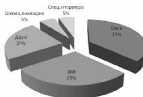
Рис. 2. Чинники, які впливають на формування статевої освіченості підлітків

Висновки. В нинішніх умовах сучасне інформаційне суспільство України зустрілося із серйозною проблемою – проблемою неспроможності застарілих методів виховання